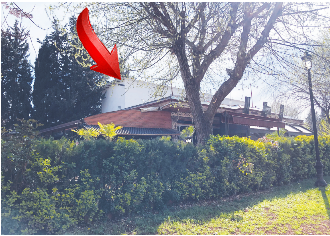
Parktan bir yer kirliyorlar, sonra belediye ile işlerini bir şekilde halledip, yayılmaya ve kat çıkmaya başlıyorlar. 100. Yıl Parkı ve Kavaklık Parkı içerisindeki çoğu kafe kiradıkları yerlerin iki katından fazlasını işgal etmeye, çimlere masa sandalye atmaya başladı.

Park içerisinde bir yer kirleyenler, bir süre sonra, park alanı içerisine kat çıkmaya ve halkın parkına masa sandalye atıp, ek binalar yaparak yayılmaya başlıyor