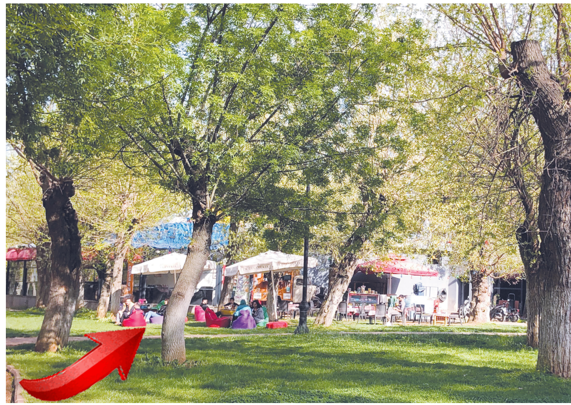
Büyükşehir Belediyesinin oy avcılığı uğruna vatandaşın parkının istila edilmesine tepki gösteriliyor. Vatandaş, "bunlara bu tavizi ve karşılığında hangi yetkili veriyor" diye soruyor.