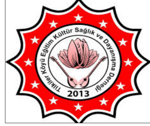
Tilkiler Yardımışma ve Dayanışma Derneği

Tüm halkımızın ve üyelerimizin Ramazan Bayramı'nı kutlar, sağlık ve mutluluklar getirmesini dilerim.