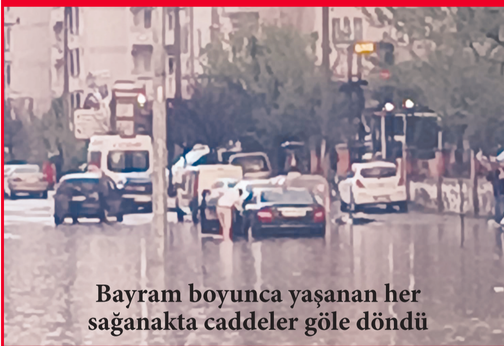
Bayram boyunca yaşanan her sağanakta caddeler göle döndü

Ramazan Bayramı'nın 1 ve 2'inci gününde etkili olan sağanak yağmur ve dolu kentte büyük sorunlara yol açtı. Yağış ve dolu nedeniyle caddeler, sokaklar ve alt geçitler sular altında kaldı. Ortaya çıkan manzara ise kentin alt yapısının yetersiz olduğunu bir kez daha kanıtladı.