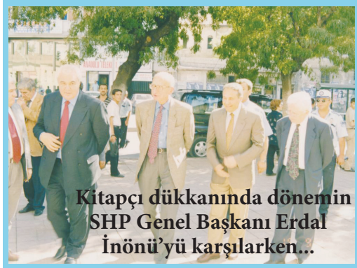
Kitapçı dükkanında dönemin SHP Genel Başkanı Erdal İnönü'yü karşılarken...

Kültür, yaşamının en önemli ve en anlamlı parçası oldu. Zeugma'dan Karkamış'a bugün kentin en gözde kültürel miraslarının gün ışığa çıkarılması ve dünyaya tanıtılması için inanılmaz çaba ve gayret gösterdi.