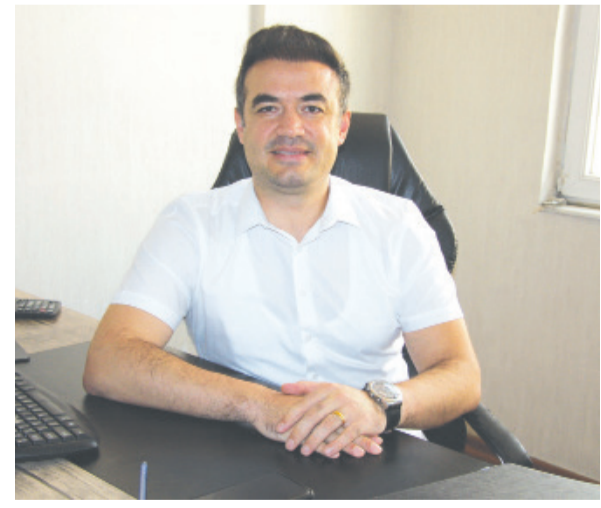
Eren Ovayolu Tilkiler Yardımlaşma ve Dayanışma Derneği

2025 yılının başta ülkemize ve tüm insanlığa barış, kardeşlik, huzur ve mutluluk getirmesi dileğiyle tüm hemşerilerimin yeni yılını kutlarım.