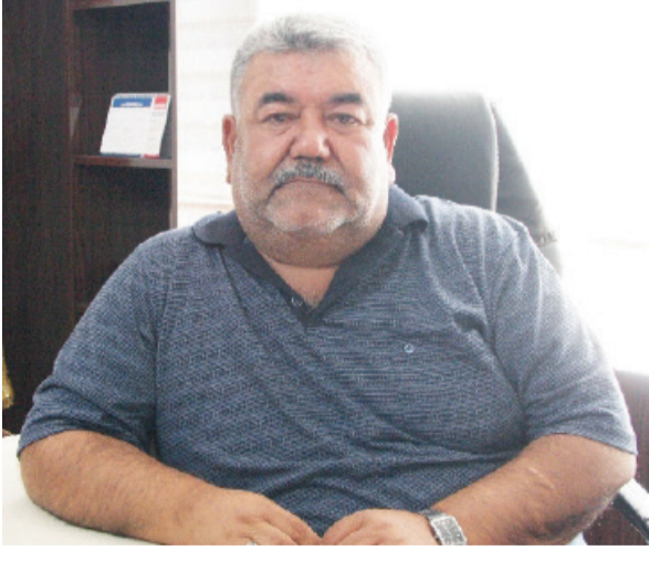
Hacı Darıcı Berberler Esnaf Odası Başkanı

Berber esnafımız başta olmak üzere tüm Gaziantep halkının 2025 yılını kutlar, boş kazançlar getirmesini dilerim.