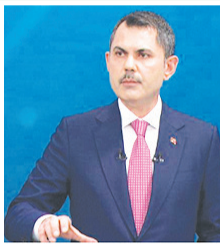
Bakan Murat Kurum Antep'te

DİSK Şube Başkanı Güdücü, "İnsanlar borcu borç ile kapatarak yaşam mücadelesi veriyor. Günümüzde en düşük ev kirası 15 bin lira. İktidar milletvekilinin '10 bin lira daha fazla versek başka ihtiyaçlarına harcar' sözleri utan verici. Bu sözler, iktidarın halktan ne kadar koptuğunun bir göstergesi" açıklamasını yaptı. AKP Genel Başkanvekili Mustafa Elitaş'ın asgari ücret zammı ile ilgili sözlerini eleştiren DİSK Gaziantep Şube Başkanı Ali Güdücü, açıklamayı talihsizlik olarak değerlendirdi.