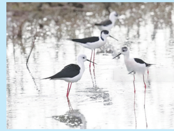
Bölgede misafir olan kuşlar arasında "uzun bacak" da yer alıyor.