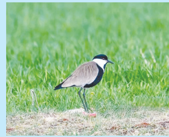
Sulak alanda dinlenmeye gelen bu kuşun ismi mahmuzlu kızkuşu.