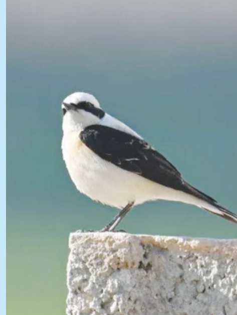
Bahar ziyaretinde bulunan kuyruk sallayan kuşu.

Özellikle ilkbahar aylarında bu bölgeye gelen kuşlar, gözlemciler ve fotoğrafçılar için eşsiz kareler sunuyor. Bölgede misafir olan kuşlar arasında turaç da yer alıyor.