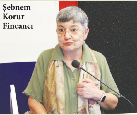
Şebnem Korur Fincancı

Çatışmalı süreçlerin en büyük bedelini yoksul emekçiler öder 4TE